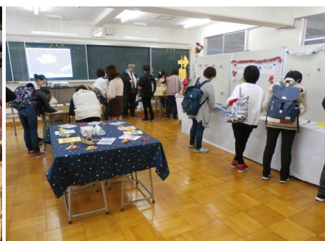
▲文化発表会通信制展示室（11月）