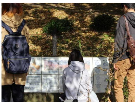
▲ウォークラリー（11月）